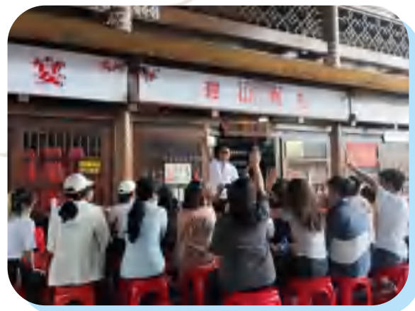
瑶医瑶药馆小课堂