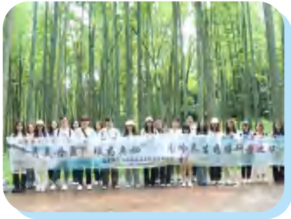
考察天井山国家森林公园