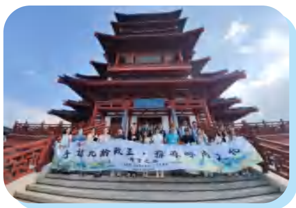
参观张九龄纪念公园