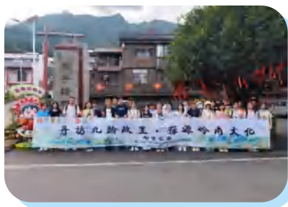
考察瑶族雕子堂村