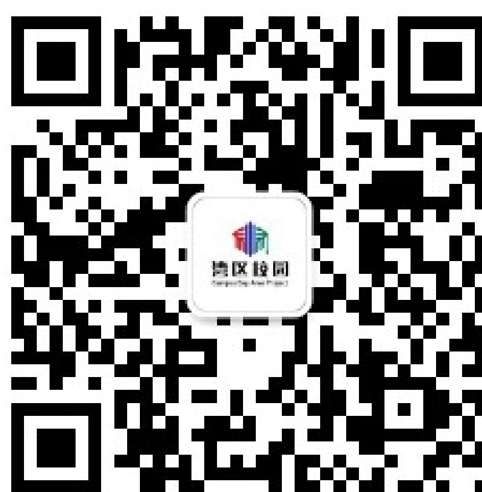
湾区校园微信公众号二维码