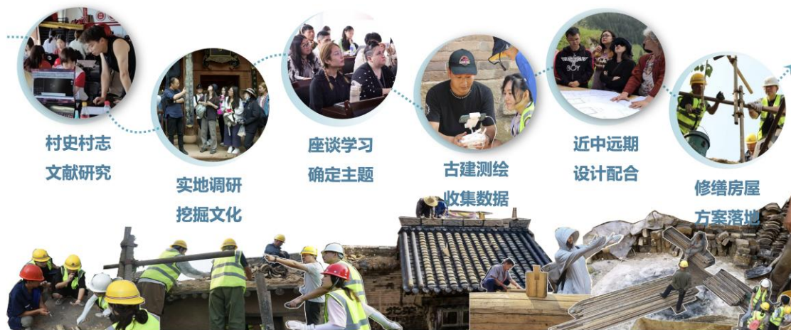
▲ 历届工作营活动内容